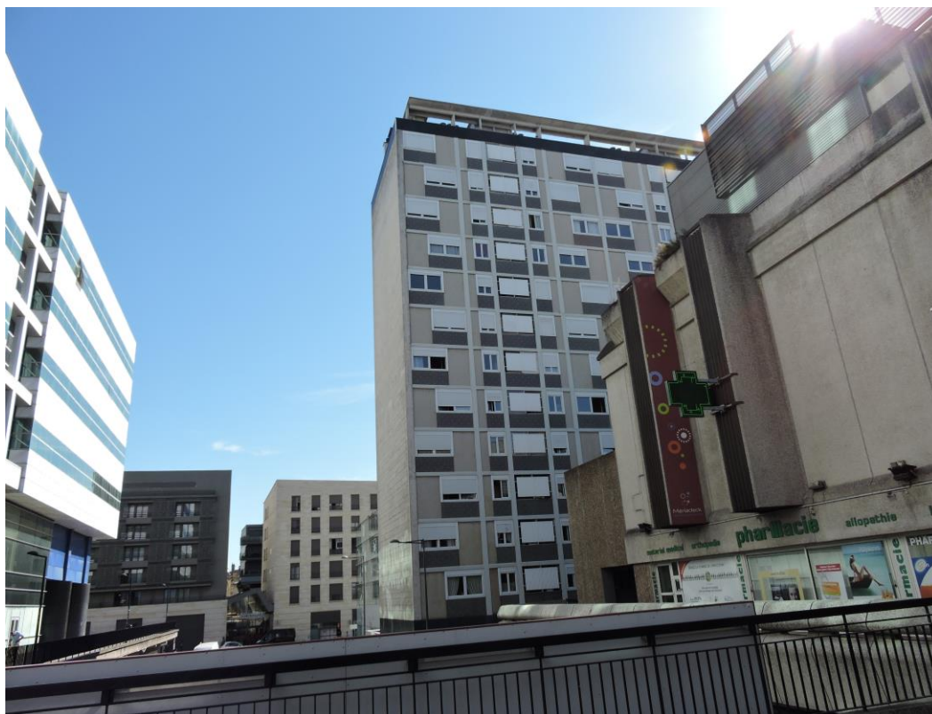
Résidence Château d'Eau