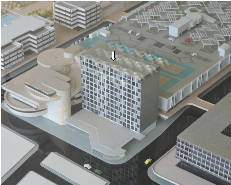
Résidence Château d'Eau - Maquette Bordeaux Métropole