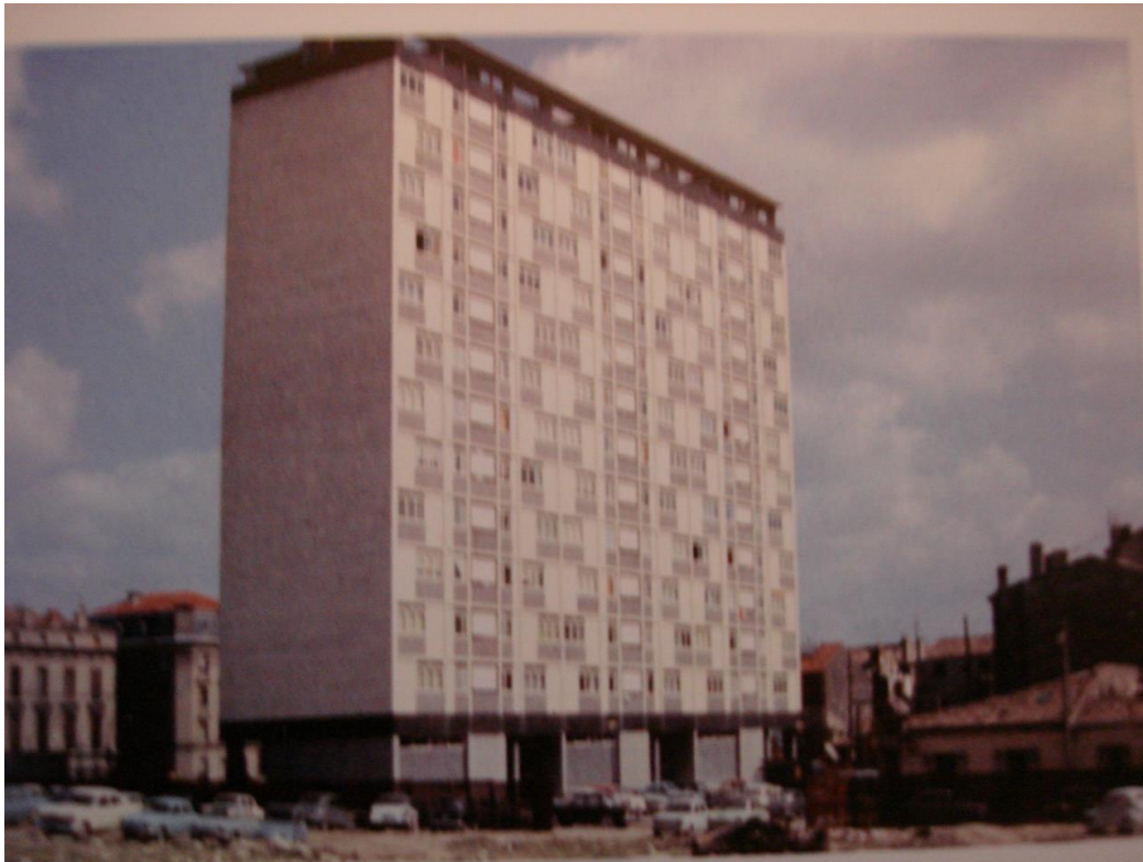
Résidence Château d'Eau - 1965