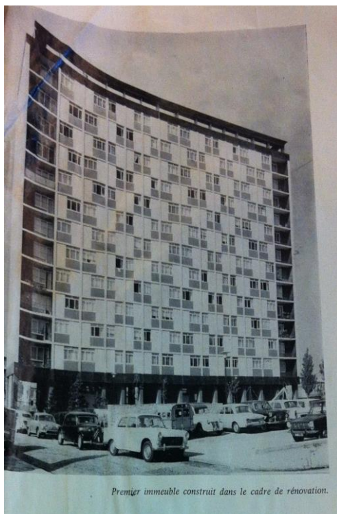
Résidence Château d'Eau 1963

Le coût de l'opération était estimé à 186 450 000 FF.