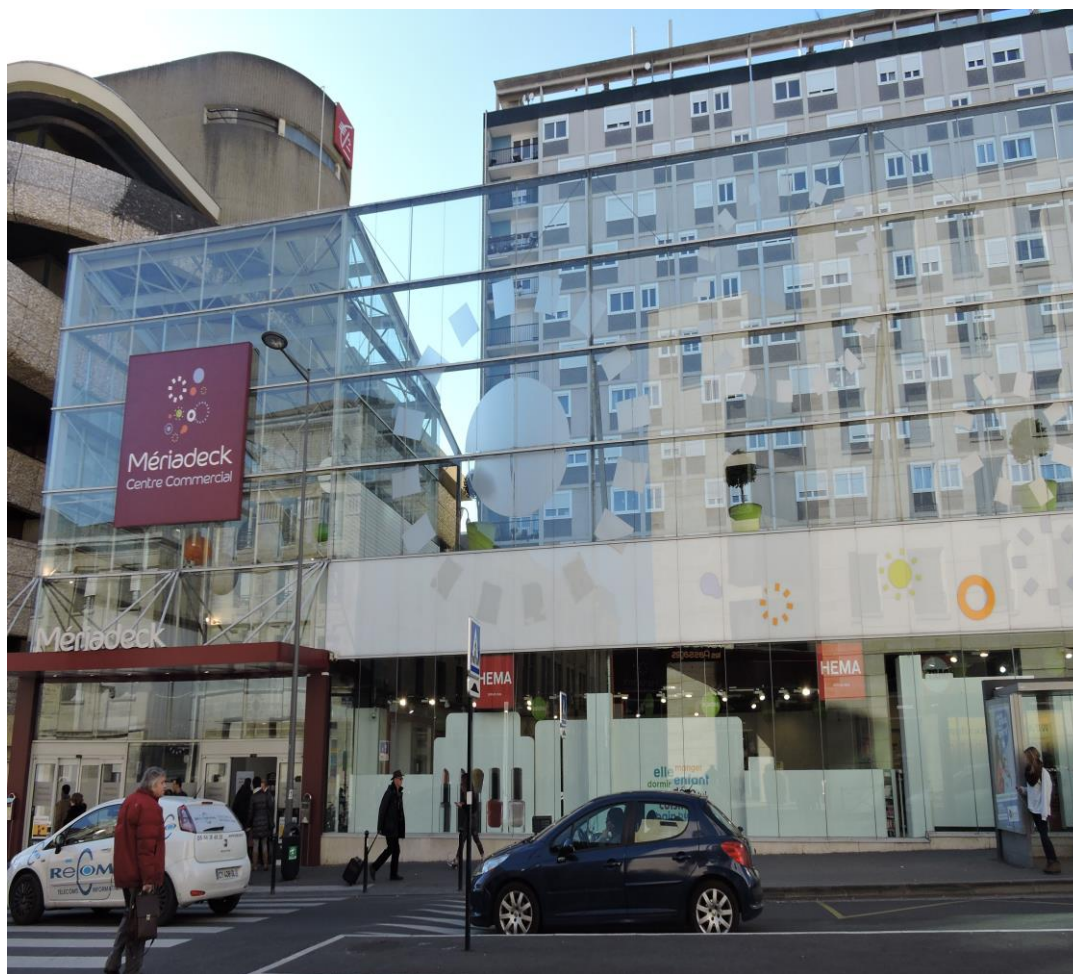
Château d'Eau - mail d'accès couvert La verrière 2008

Le bâtiment est en recul de 30 m par rapport à la rue du Château d'Eau, pour permettre l'implantation d'un jardin et d'une aire de jeux donnant sur la rue. Mais en 1963, EDF implante, sans autorisation, entre l'immeuble et la rue, sur l'emplacement prévu pour le jardin, un poste de transformation de 3 m de hauteur et de plus de 20 m 2 . Jean Willerval, architecte coordinateur de l'Opération, demandera à EDF de "camoufler" sa construction et la totalité du futur espace de jeux sera finalement remplacée par des commerces. Puis le mail prévu pour l'entrée du centre commercial sera couvert. Enfin, le centre commercial installera sur le toit du passage une structure en métal et en verre.