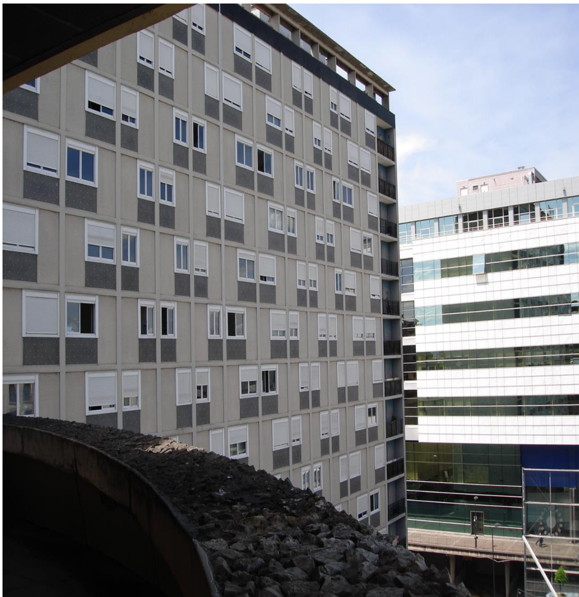
Château d'Eau : le mur rideau 2016

Le rez-de-rue présentait une ébauche de taille de guêpe, aujourd'hui masquée par les constructions du centre commercial.